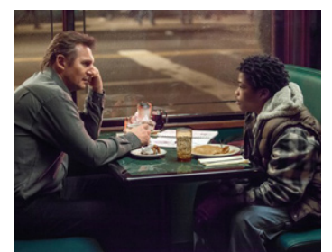
2014 BALADE ENTRE LES TOMBES (A Walk among the Tombstones) de Scott Frank