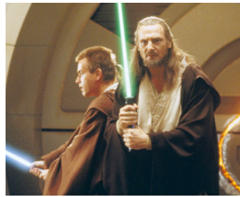
1999 LA MENACE FANTÔME (The Phantom Menace) de G. Lucas avec Ewan McGregor