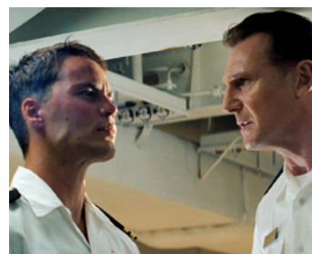
2012 BATTLESHIP (Battleship) de Peter Berg avec Alexander Skarsgaard