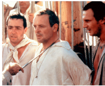
1984 LE BOUNTY (The Bounty) de Roger Donaldson avec Daniel Day-Lewis, Anthony Hopkins