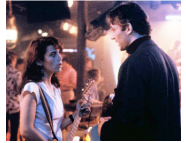
1988 SATISFACTION (Satisfaction) de Joan Freeman avec Justine Bateman