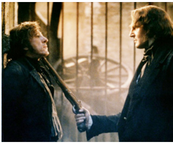
1998 LES MISÉRABLES (Les Misérables) de Bill August avec Geoffrey Rush