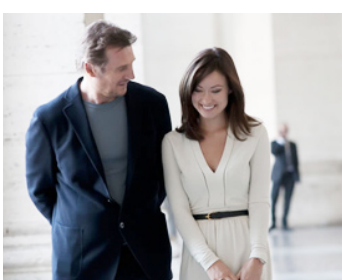
2013 PUZZLE (Third Person) de Paul Haggis avec Olivia Wilde