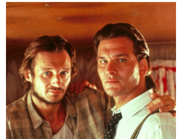
1989 UN FLIC À CHICAGO (Next of Kin) de John Irvin avec Patrick Swayze