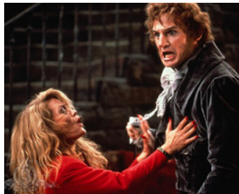
1988 HIGH SPIRITS (High Spirits) de Neil Jordan avec Beverly D'Angelo