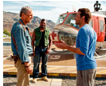
2010 L'AGENCE TOUS RISQUES (The A-Team) de Joe Carnahan avec Quinton Jackson, Bradley Cooper