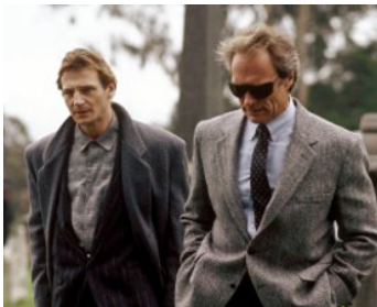
1988 LA DERNIÈRE CIBLE (The Dead Pool) de Buddy Van Horn avec Clint Eastwood