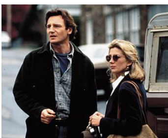
1994 NELL (Nell) de Michael Apted avec Natasha Richardson