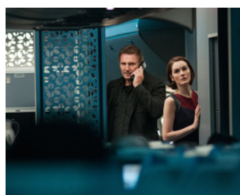
2014 NON STOP (Non-Stop) de Jaume Collet-Serra avec Michelle Dockery