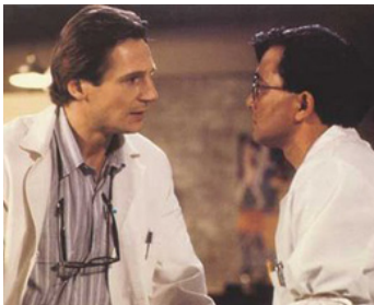
1990 DARKMAN (Darkman) de Sam Raimi avec Nelson Machita