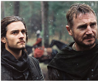
2005 KINGDOM OF HEAVEN (Kingdom of Heaven) de Ridley Scott avec Orlando Bloom