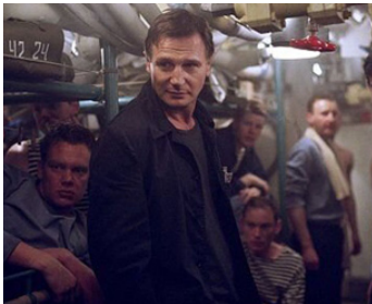
2002 K-19 LE PIÈGE DES PROFONDEURS (K19 the Widowmaker) de Kathryn Bigelow