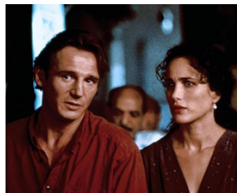
1993 LE RUBIS DU CAIRE (Ruby Cairo) de Graeme Clifford avec Andie MacDowell