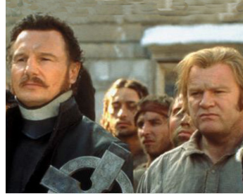
2002 GANGS OF NEW YORK (Gangs of New York) de Martin Scorsese avec Brendan Gleeson