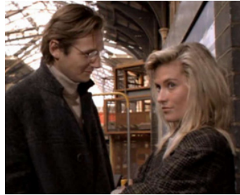
1987 L'IRLANDAIS (A Prayer for dying) de Mike Hodges avec Alison Doody