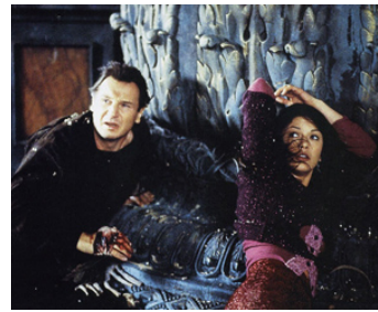
1999 HANTISE (The Haunting) de Jan de Bont avec Catherine Zeta-Jones