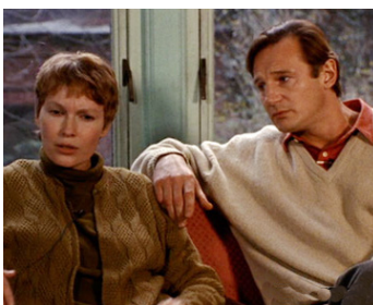
1992 MARIS ET FEMMES (Husbands and Wives) de Woody Allen avec Mia Farrow