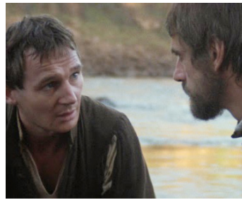
1986 MISSION (The Mission) de Roland Joffé avec Jeremy Irons