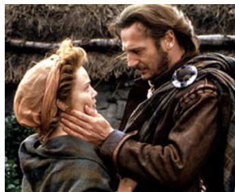
1995 ROB ROY (Rob Roy) de Michael Caton-Jones avec Jessica Lange