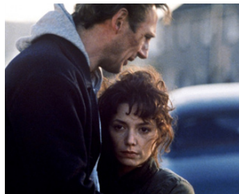
1990 BIG MAN (The Big Man) de David Leland avec Joanne Whalley