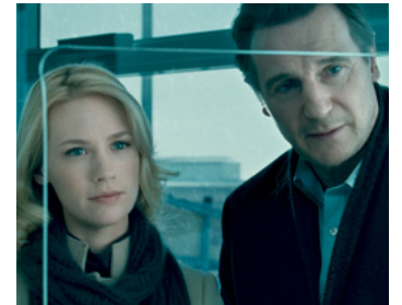
2011 SANS IDENTITÉ (Unknown) de Jaume Collet Serra avec Diane Kruger