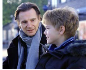
2003 LOVE ACTUALLY (Love Actually) de Richard Curtis avec Thomas Sangster