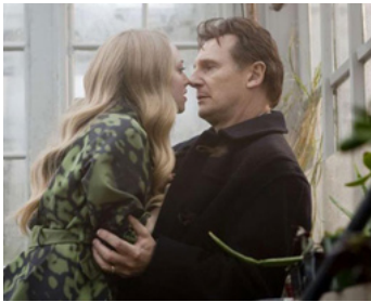
2009 CHLOË (Chloë) d'Atom Egoyan avec Amanda Seyfried