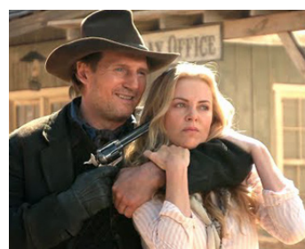
2014 ALBERT À L'OUËST (A Million Ways to die in the West) de S. McFarlane avec Ch. Theron