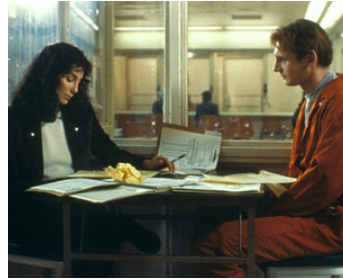
1987 SUSPECT DANGEREUX (Suspect) de Peter Yates avec Cher