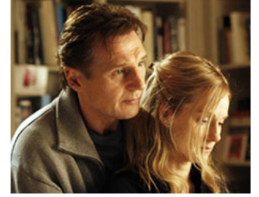
2008 THE OTHER MAN (The Other Man) de Richard Eyre avec Laura Linney