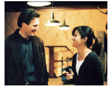
2000 MAFIA PARANO (Gun Shy) d'Erick Blakeney avec Sandra Bullock