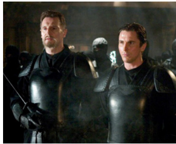
2005 BATMAN BEGINS (Batman Begins) de Christopher Nolan avec Christian Bale