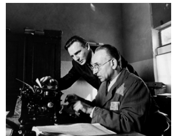
1993 LA LISTE DE SCHINDLER (Schindler's List) de Steven Spielberg avec Ben Kingsley