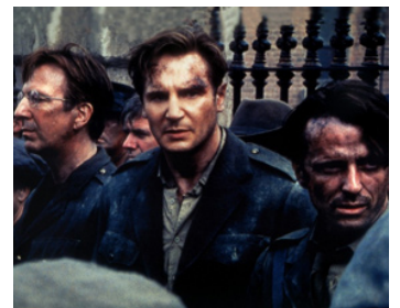
1996 MICHAEL COLLINS (Michael Collins) de Neil Jordan avec Alan Rickman, Aidan Quinn