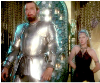
1981 EXCALIBUR (Excalibur) de John Boorman avec Helen Mirren