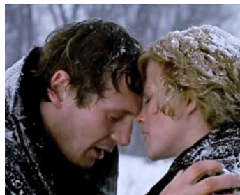
1993 ETHAN FROME (Ethan Frome) de John Madden avec Patricia Arquette