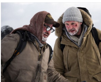
2012 LE TERRITOIRE DES LOUPS (The Grey) de Joe Carnahan avec Dermot Mulroney