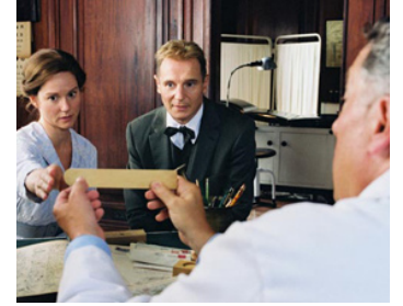
2004 DOCTEUR KINSEY (Kinsey) de Bill Condon avec Laura Linney