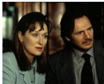
1996 LE POIDS DU DÉSHONNEUR (Before and After) de Barbet Schroeder avec Meryl Streep