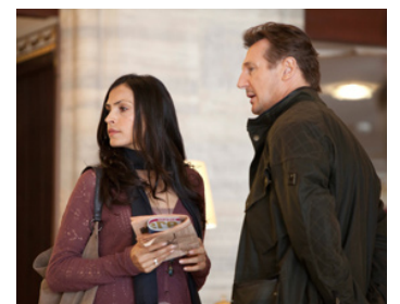
2012 TAKEN 2 (Taken 2) d'Olivier Megaton avec Famke Janssen